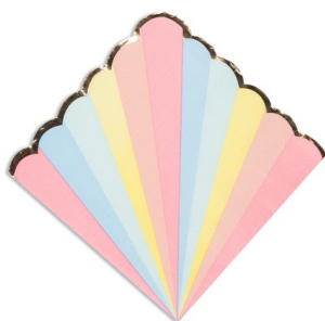
Serviette de table x16 Réf : 10407A