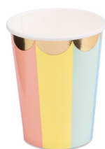
Gobelet x8 Réf : 10406A